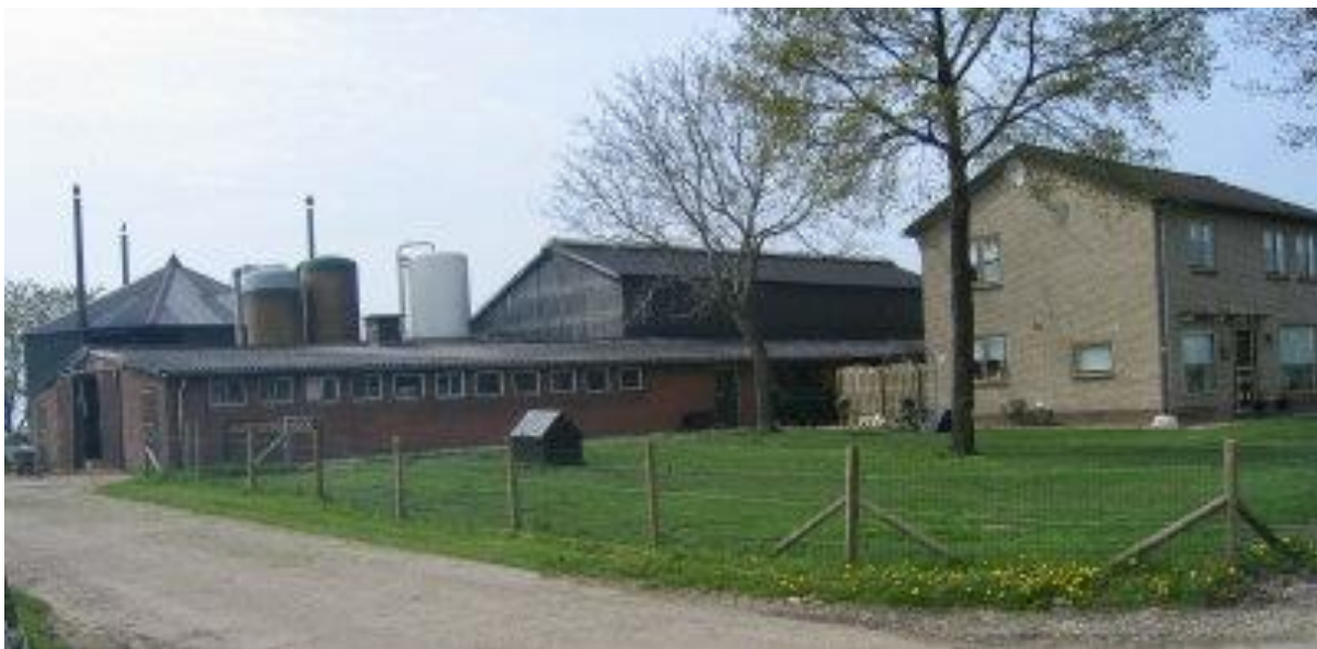
Bij functieverandering moeten alle agrarische gebouwen op het perceel gesloopt worden

Bij het berekenen van de oppervlakte van de gesloopte bedrijfsgebouwen worden overigens alleen de bedrijfsgebouwen (stallen/loodsen/glasopstanden/opslagruimtes) meegerekend. Aan de sloop van bouwwerken, bij recht toegestane bijgebouwen bij de woning, tunnelkassen en overige voorzieningen kunnen dus geen bouw mogelijkheden worden ontleend.