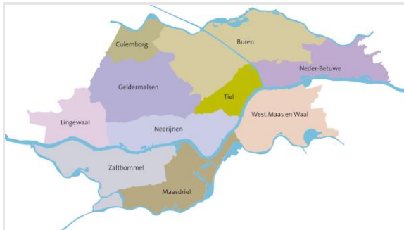
Gemeenten van Regio Rivierenland

De Regio Rivierenland wordt gekenmerkt door het karakteristieke rivierenlandschap met zijn rivieren, uiterwaarden, dijken, oeverwallen en komgebieden. De oeverwallen zijn landschappelijk relatief besloten gebieden waar van oudsher de bebouwing geconcentreerd is en waar de meeste dorpen zijn ontstaan. De oeverwallen worden gekenmerkt door een grote verscheidenheid aan kleinschalige woon-, werk en agrarische functies. Wat betreft de agrarische functies gaat het veelal om relatief kleine bedrijven waarvan een groot deel actief is in de fruitteelt. Op veel plaatsen zijn kassen en/of tijdelijke teeltondersteunende voorzieningen zoals foliekassen aanwezig. De agrarische bedrijfsgebouwen zijn vaak een combinatie van oudere bakstenen schuren en moderne damwandloodsen.