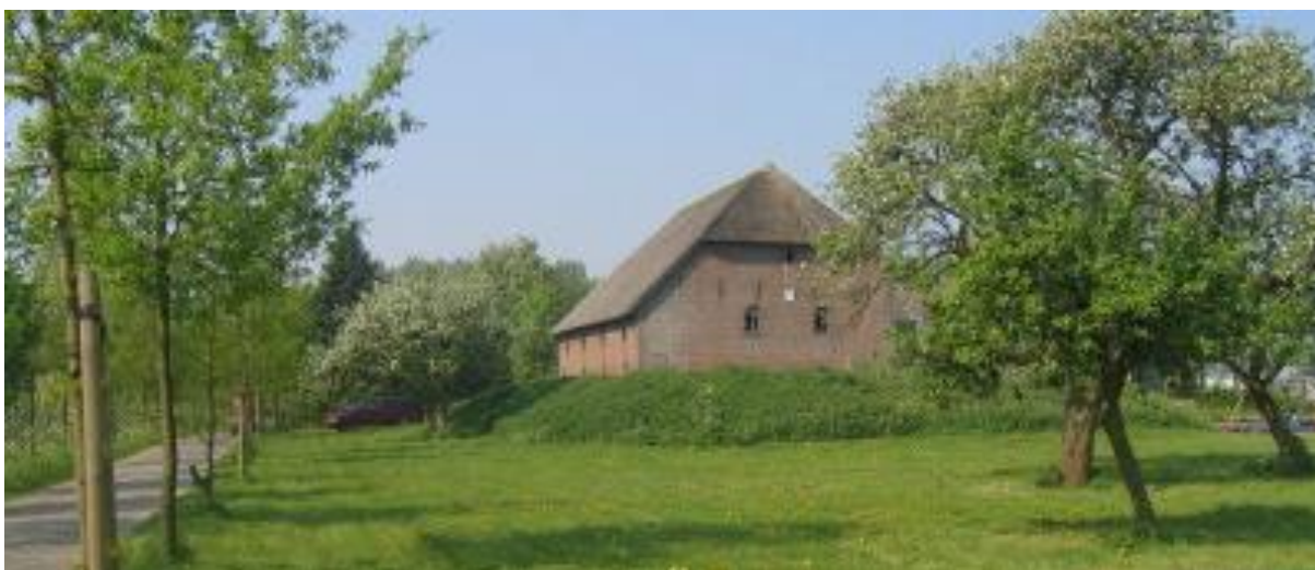
Behoud van monumentale bedrijfsgebouwen door ruime mogelijkheden voor hergebruik

De in dit beleidskader genoemde mogelijkheden voor hergebruik van agrarische bedrijfsgebouwen gelden nadrukkelijk niet voor kassen. Uitgangspunt bij kassen is dat die bij functieverandering altijd dienen te worden gesloopt.