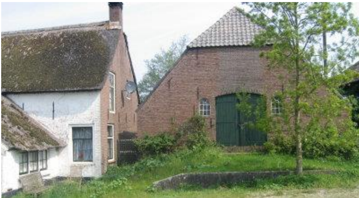
Agrarische bebouwing met karakteristieke en/of beeldbepalende waarde

Agrarische bedrijfsbebouwing in het buitengebied die zijn functie waarvoor deze eerder is bestemd, vergund en gebruikt heeft verloren of op korte termijn gaat verliezen.