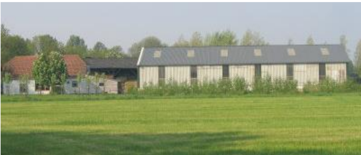
Sloopkosten van vrijgekomen agrarische bebouwing kunnen worden bekostigd uit extra te verkrijgen bouw mogelijkheden

De in dit beleidskader genoemde verruimde mogelijkheden voor de bouw van woningen of bijgebouwen of het uitbreiden daarvan, worden enkel geboden op voorwaarde dat alle bedrijfsgebouwen, bouwwerken en bijbehorende voorzieningen (zie overzicht in bijlage 1) op het perceel worden gesloopt. Bij het berekenen van de oppervlakte van de gesloopte bedrijfsgebouwen worden de bouwwerken en bijbehorende voorzieningen niet meegerekend.