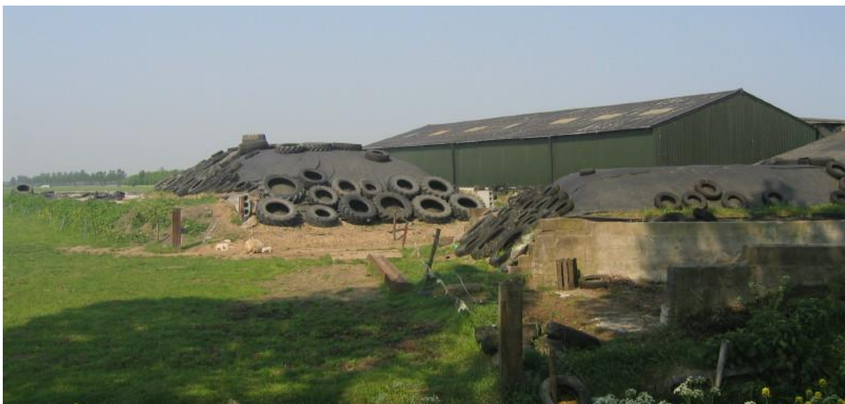
Landschappelijke kwaliteit buitengebied vergroten door sloop van landschapsontsierende agrarische bebouwing

Voorts kunnen aan dit beleidskader geen rechten worden ontleend. Het blijft een afweging of individuele initiatieven strekken tot verbetering van de ruimtelijke kwaliteit en voldoen aan het begrip “een goede ruimtelijke ordening”. Bij die afweging kunnen ook andere ontwikkelingen die niet in dit beleidskader zijn benoemd van belang zijn, zoals bijvoorbeeld beleid van andere overheden, “woningbouwcontingenten” of milieuzoneringen.