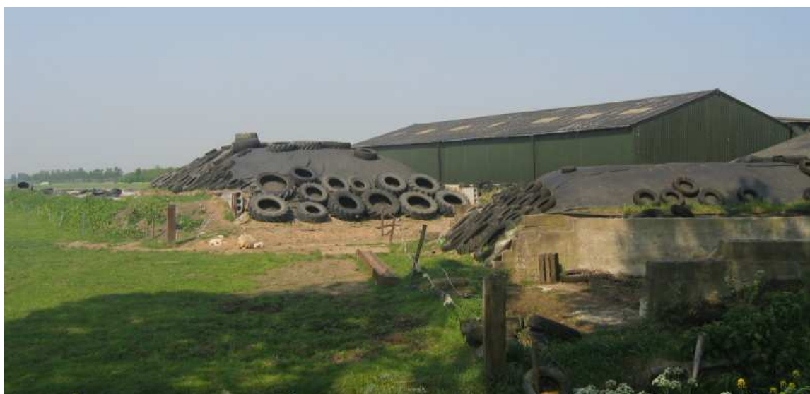
Landschappelijke kwaliteit buitengebied vergroten door sloop van landschapsontsierende agrarische bebouwing

Wij zullen dit beleidskader in 2008 evalueren en eventueel aanpassen op nieuwe ontwikkelingen, nieuwe wetgeving (bijvoorbeeld grondexploitatiewet en nieuwe WRO) en de mate waarin functieverandering onder de voorwaarden zoals genoemd in dit beleidskader van de grond komt.