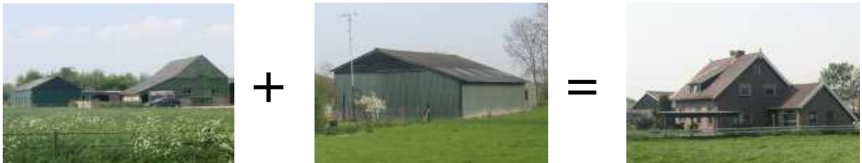
Sanering van verspreid liggende agrarische bebouwing kan een belangrijke bijdrage leveren aan het vergroten van de landschappelijke kwaliteit van het buitengebied