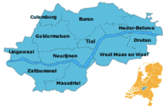
Ligging binnen Rivierenland samenwerkende gemeenten

De verwachting is dat een aanzienlijk aantal agrarische bedrijven op de oeverwallen door hun relatief beperkte omvang de komende tijd de bedrijfsvoering zal staken. Voor de oudere bakstenen schuren geldt dat verbouw tot woon- of werkruimte een goede optie is, mits de bouwkundige kwaliteit van de schuren nog relatief goed is en mits de schuren qua vormgeving geschikt zijn als woon- of werkruimte. Voor de moderne damwandloodsen geldt dat hergebruik voor bedrijfsmatige functies een optie is maar dat vervangende nieuwbouw in sommige gevallen de voorkeur verdient om de ruimtelijke en landschappelijke kwaliteit van het buitengebied te vergroten.