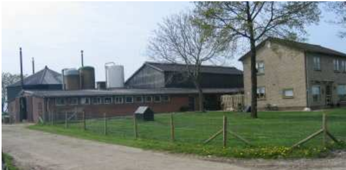
Bij functieverandering moeten alle agrarische gebouwen op het perceel gesloopt worden

Bij het berekenen van de oppervlakte van de gesloopte bedrijfsgebouwen worden overigens alleen de stallen en opslagruimtes meegerekend. Aan de sloop van andere agrarische opstanden kunnen dus geen bouwrechten worden ontleend. Verder kunnen geen bouwrechten worden ontleend aan de sloop van bedrijfsgebouwen tot een oppervlakte zoals bij recht is toegestaan bij een burgerwoning.