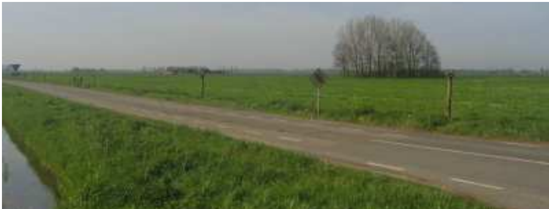
Karakteristiek open komgebied

In met name de gemeente Maasdriel zijn relatief veel champignonkwekerijen gevestigd die gekenmerkt worden door de enorme loodsen. De loodsen zijn weliswaar geschikt voor verschillende vormen van bedrijfsmatig hergebruik, maar uit ruimtelijk en landschappelijk oogpunt is het vaak ook wenselijk te streven naar sloop en vervangende nieuwbouw van bedrijfsruimte of woningen.