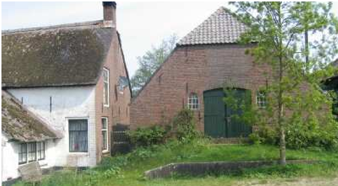
Agrarische bebouwing met karakteristieke en/of beeldbepalende waarde

Een gebouw waarin meerdere wooneenheden zijn gevestigd.