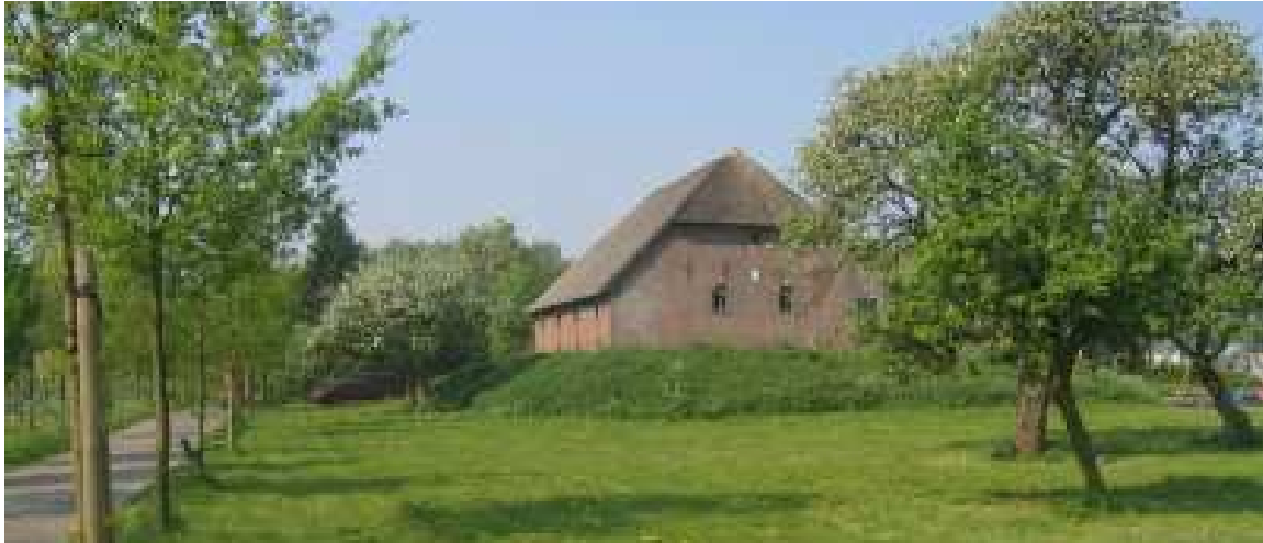
Behoud van monumentale bedrijfsgebouwen door ruime mogelijkheden voor hergebruik