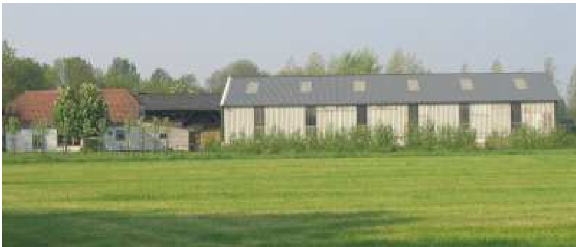
Sloopkosten van vrijgekomen agrarische bebouwing kunnen worden bekostigd uit extra te verkrijgen bouwrechten

De onderstaand beschreven regeling voor functieverandering naar wonen geldt overigens ook voor bedrijfsgebouwen in het buitengebied die nooit voor agrarische doeleinden gebruikt zijn (mits deze wel rechtmatig gebruikt zijn). Op deze wijze willen de binnen de regio Rivierenland samenwerkende gemeenten bevorderen dat ook verouderde vrijgekomen niet-agrarische bedrijfsbebouwing in het buitengebied gesaneerd wordt.