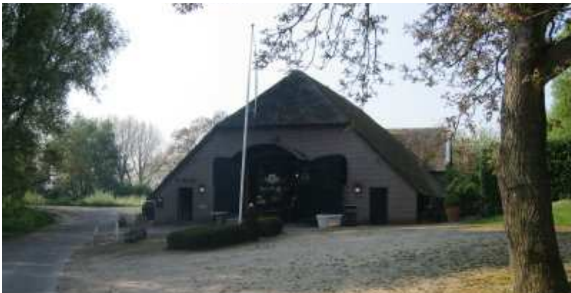
Het buitengebied is een aantrekkelijke vestigingsplaats voor bepaalde bedrijven

De gemeenten in de regio Rivierenland zijn van mening dat de vestiging van bedrijvigheid in vrijgekomen agrarische bedrijfsgebouwen een impuls kan geven aan de aantrekkelijkheid en vitaliteit van het buitengebied. Dat wil echter niet zeggen dat het buitengebied geschikt is voor alle soorten bedrijvigheid. In onze visie zou in het buitengebied onder de voorwaarden zoals geformuleerd in paragraaf 2.1 plaats moeten zijn voor bedrijvigheid die aan het buitengebied gebonden is, recreatieve voorzieningen en overige kleinschalige bedrijvigheid die qua karakter en uitstraling in het buitengebied past. Grootschalige bedrijvigheid of bedrijvigheid die qua uitstraling niet in het buitengebied past, behoort zich op een bedrijventerrein te vestigen.