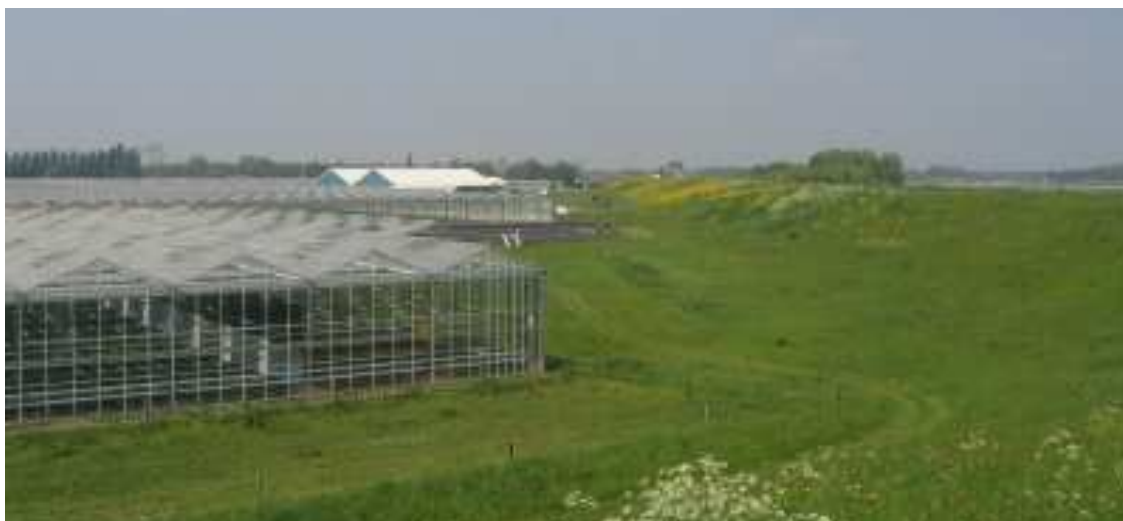
Sloop van kassen ten behoeve van het vergroten van de landschappelijke kwaliteit van het buitengebied

In gebieden die zijn aangewezen als glastuinbouwconcentratiegebied, worden geen mogelijkheden geboden voor het oprichten van nieuwe woon- en bedrijfsgebouwen in ruil voor de sloop van leegstaand glas. De bouw van woningen en bedrijfsruimte zou de ruimte voor de glastuinbouw beperken en de grondprijs opdrijven. In de regio Rivierenland zijn delen van de Bommelerwaard en gebieden rond Tuil en Est aangewezen als gebieden waar de glastuinbouw in de toekomst geconcentreerd zal worden.